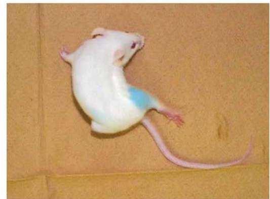
体躯の屈曲、下肢の強直性痙攣を伴う発症マウス

分離菌株を培養 (4~6 日間) した増菌培地を濾過滅菌 (0.22 μm) し、その濾液 (0.2~0.4ml/匹) をマウス (a) の大腿部皮下に注射する。また、別のマウス (b) には、予め約 100 単位の破傷風抗体 (0.5ml) を静脈内投与する。破傷風抗体 (通常 1 単位の抗体量は 1,000 ~10,000 マウス致死量の